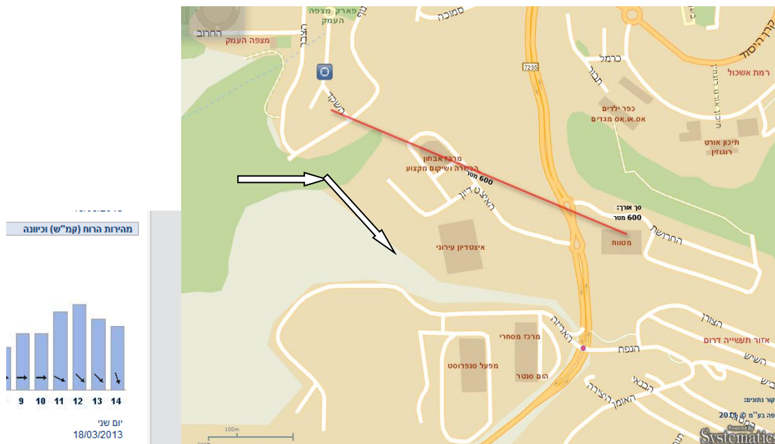
המרחק בין הבית למטווח 600 מ